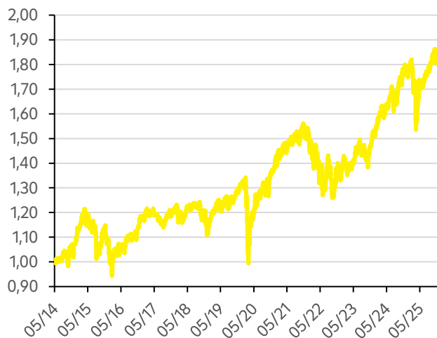
Vývoj hodnoty fondu Strategy 75